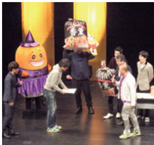
お笑いライブ後は抽選会で盛り上がります