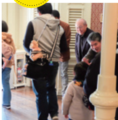
社長をはじめ、関係者全員でお見送り