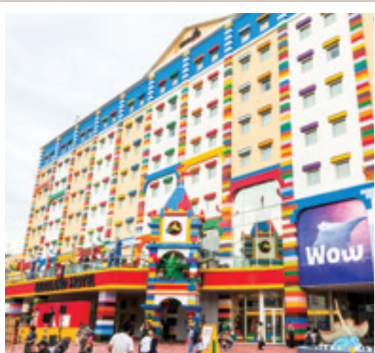
2018年4月オープンのLEGOLAND® Japan Hotel でもフード類を提供しています

LEGOLAND®Japanへのご招待キャンペーンを中部、関東、関西で実施しました。LEGOLAND® Japanではオフィシャルマーケティングパートナーとして、パーク内のレストラン「ナイト・テーブル・レストラン」などでフード類を提供しています。これからも食を通じた子どもたちの思い出づくりをお手伝いしていきます。