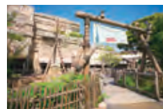
ユカタン・ベースキャンプ・グリル